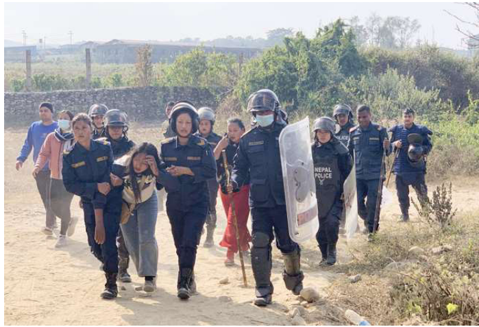
जग्गा हडपन खोज्नेलाई नियन्त्रणमा लिई प्रहरी ।