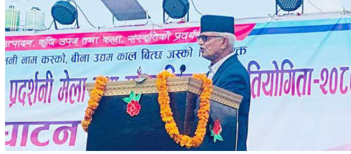
मेलाको उद्घाटन समारोहलाई सम्बोधन गर्नुहुँदै पूर्व मुख्यमन्त्री डोरमणि पौडेल