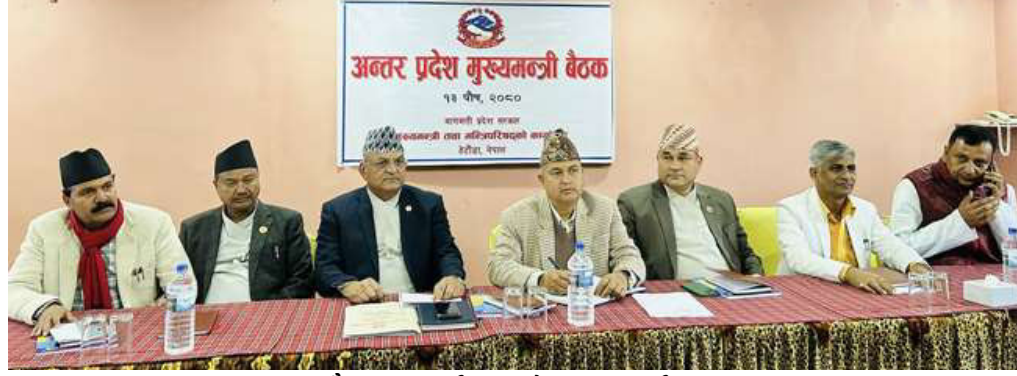
बैठकमा सहभागी सात प्रदेशका मुख्यमन्त्रीहरु ।