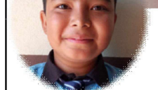
सम्पूर्ण पण्डित कक्षा-८, निर्मल मावि, हेटौंडा-१९