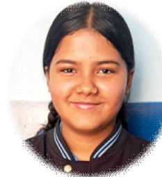
संस्कृति लुईटेल करुणाकी खानी मेरी प्यारी आमा ममताकी खानी मेरी प्यारी आमा

यो धर्तीमा जन्मायौ सारा संसार देखायौ आफ्ना सपनाहरू मारेर मेरा सपना पूरा गर्नतिर लाग्यौ