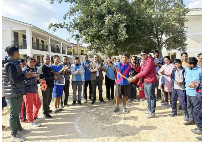
वार्षिकोत्सवअन्तर्गत खेलकुद कार्यक्रमको सुरुवात गरिँदै ।