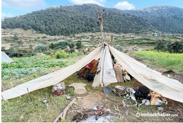
पालको भ्रमा भूकम्पपीडित ।

काठमाडौं: जाजरकोट भूकम्पका लाभग्राहीको संख्या बढेको छ। विवरण संकलनको क्रम जारी रहेकाले संख्या अझै बढ्ने अनुमान गरिएको छ। राष्ट्रिय विपद् जोखिम न्यूनीकरण तथा व्यवस्थापन प्राधिकरणका अनुसार सोमबारसम्म लाभग्राहीको संख्या ६७ हजार सात सय ८० पुगिसकेको छ। यो अझै थपिने क्रममा छ। यसअघि ५९ हजार भन्दाबढी लाभग्राही कायम भएकामा पछिल्लो अद्यावधिक