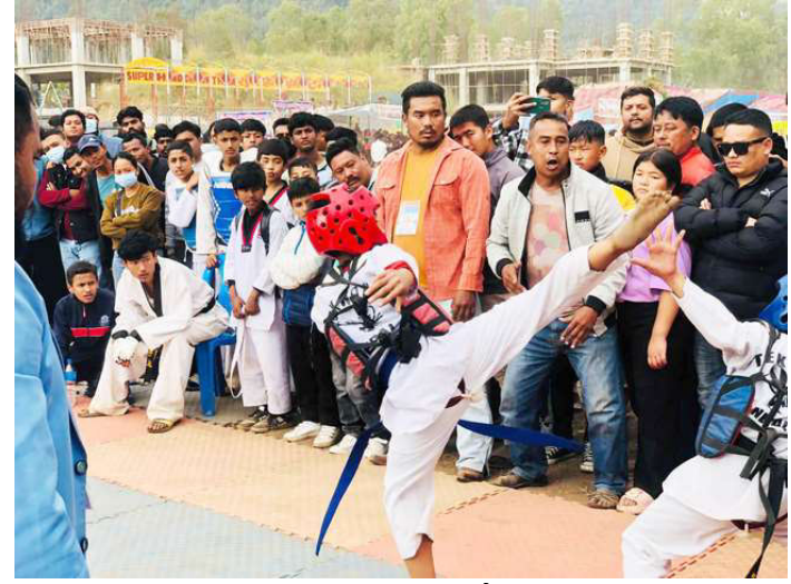
तेक्वान्दो प्रतियोगितामा भिड्दै खेलाडी ।