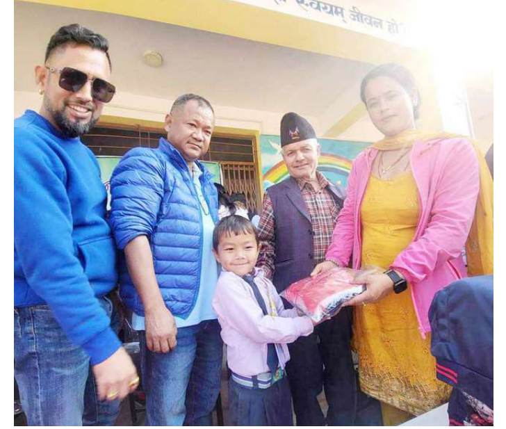
विद्यार्थीलाई पोशाक वितरण गरिँदै ।