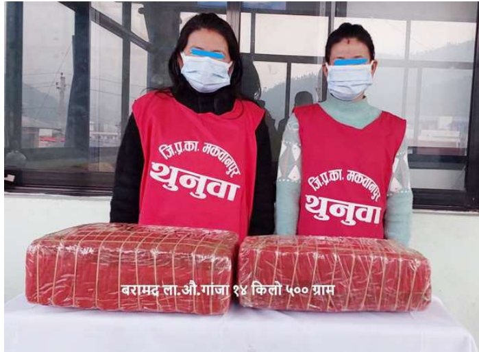
लागुऔषध गाँजासहित थानाभन्ज्याङबाट पक्राउ परेका महिलाहरु ।