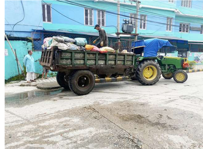
फोहोर संकलनका लागि प्रयोग हुने ट्र्याक्टर ।