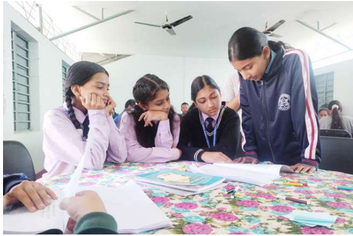
शनिवार जनप्रिय माविमा आयोजना गरिएको कार्यशालामा सहभागी विद्यार्थीहरू ।