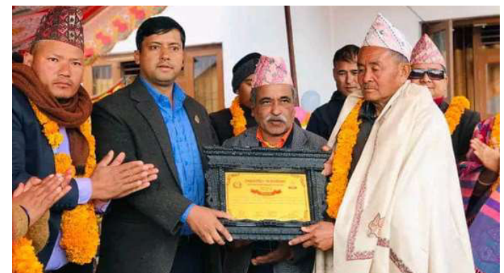
वडा कार्यालय भवन निर्माणका लागि जग्गादातालाई सम्मान गरिँदै ।