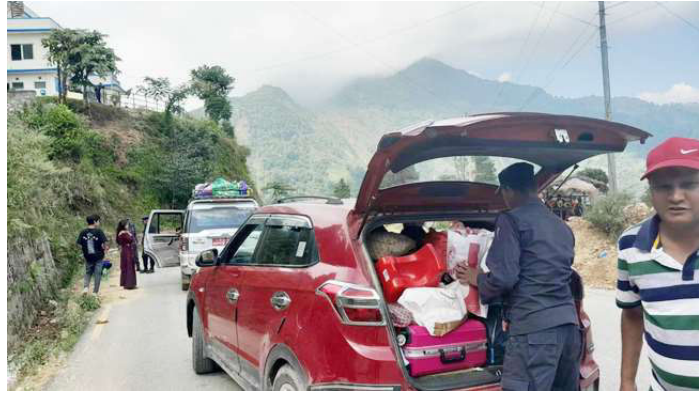
प्रहरीले सुरक्षाजाँच गर्दै ।