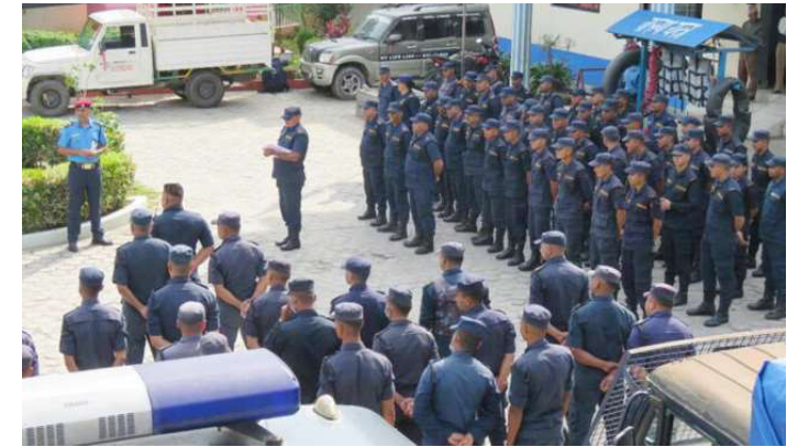
लागुऔषध गाँजा र अफिम खेती फँडानी गर्न खटिने प्रहरी टोली जिल्ला प्रहरी कार्यालय मकवानपुर परिसरमा।