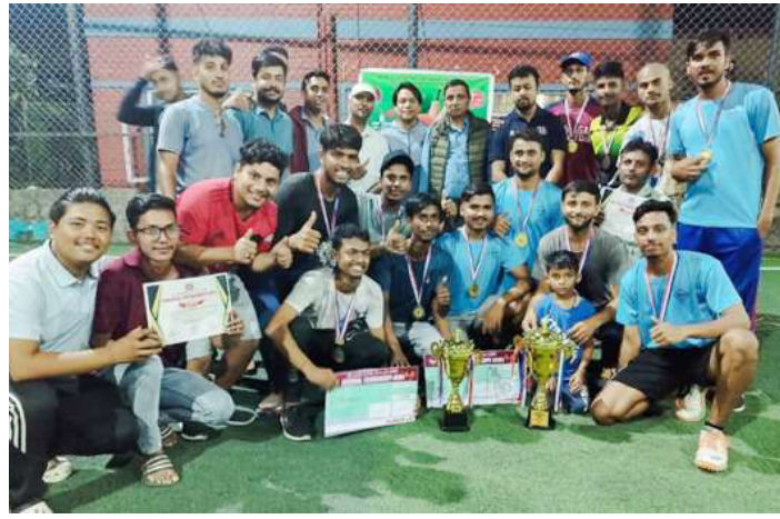
उपाधीसाथ भ्याक्सन क्रिकेट क्लबका खेलाडीहरूसँग।