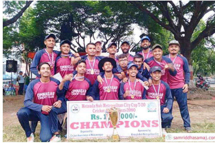
उपाधि साथ ओमनगर क्रिकेट क्लबको टिम।