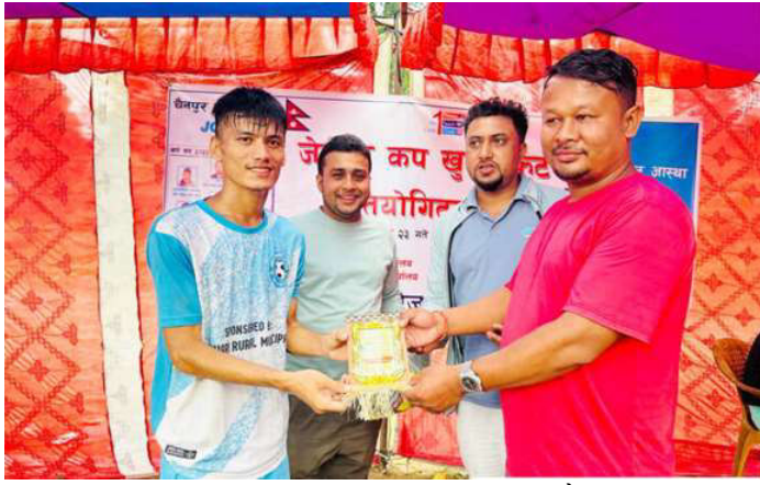
म्यान अफ द म्याचको टुफी वितरण गरिँदै।