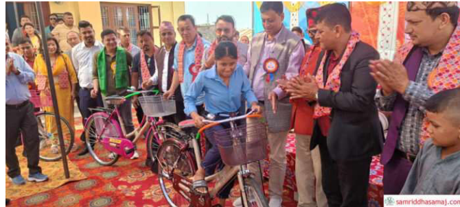
विद्यार्थीलाई साइकल वितरण गरिँदै।