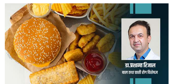
दिएनन् भने भविष्यमा बच्चाहरूले धेरै स्वास्थ्य समस्या सामना गर्नुपर्ने हुन सक्छ । खराब जीवनशैली र खानपानले

पछिल्लो समय बालबालिका वयस्कहरूको तुलनामा रोगको बढी जोखिममा छन्, किनभने बालबालिकाहरू घरको भन्दा बाहिरको खाना रचाउँछन्, बाहिर खेल्न जान भन्दा मोबाइलमा गेम खेल्न रचाउँछन् । यदि आमाबाबुले आफ्ना बच्चाहरूको जीवनशैली र खानपानमा ध्यान