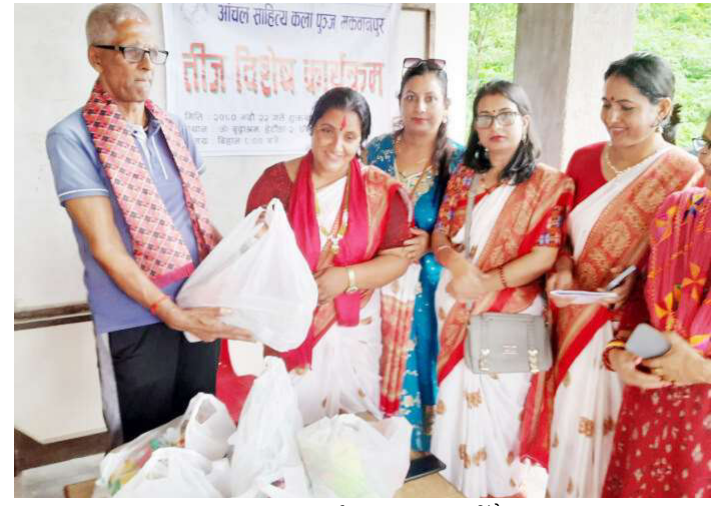
खाद्यान्न सामग्री हस्तान्तरण गरिँदै ।