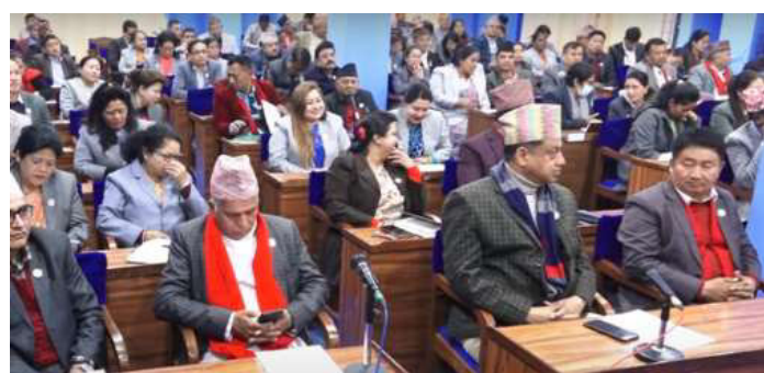
प्रदेश सभा बैठकमा सहभागी सदस्यहरू। फाइल तस्वीर।