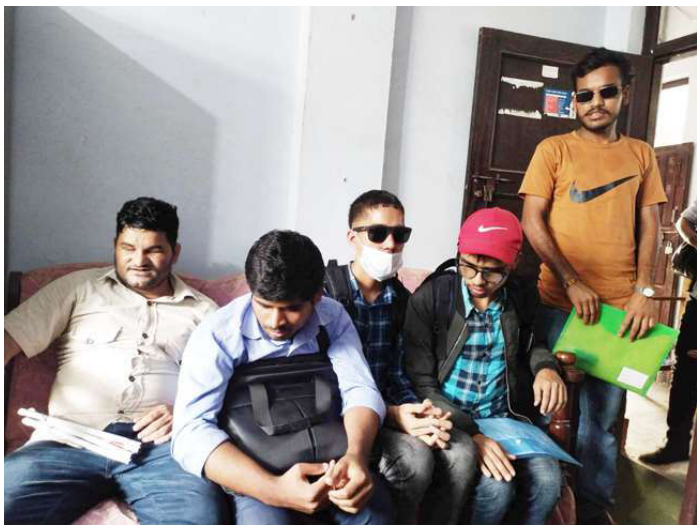
शिक्षा विकास तथा समन्वय इकाईमा बिहिवार लेखन सहयोगीको पत्र बनाउन पुगेका दृष्टिविहिन परीक्षार्थी ।

समाज संवाददाता हेटौँडा: शिक्षक सेवा आयोगले प्राथमिक तहको शिक्षक नियुक्तिअन्तर्गत आज शनिबार दोस्रो पत्रको परीक्षा सञ्चालन गर्दैछ। बागमती प्रदेशको परीक्षा आज हेटौँडामा हुँदैछ। प्रथम पत्रमा उत्तीर्ण तीन हजार ९९ उम्मेदवार परीक्षामा सहभागी हुनेछन्। परीक्षा सञ्चालनका लागि शिक्षा विकास तथा समन्वय इकाईले आवश्यक तयारी गरेको छ। परीक्षामा सहभागी हुने दृष्टिविहिन उम्मेदवारले भने समस्या भोग्नुपरेको