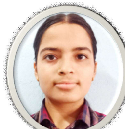
३) प्राप्ति चौलागाई

अरुको गिद्दे नजर हेरी हेरी हुकेकी हुँ म आमाको आँश र बुवाको परिश्रम देखी लुकेकी छैन म