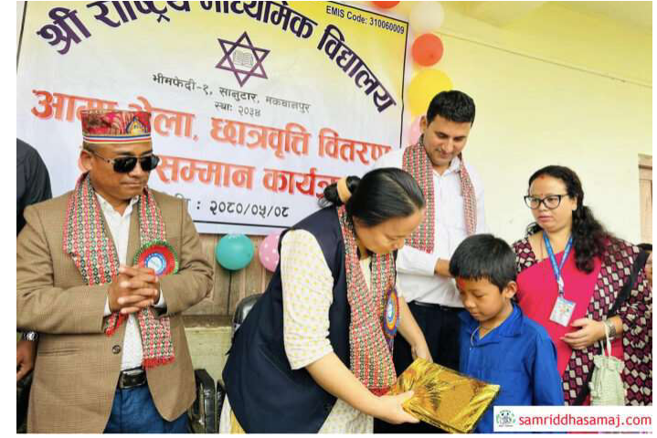
विद्यार्थीलाई पुरस्कार गर्नुहुँदै मन्त्री कुमारी मोक्तान।