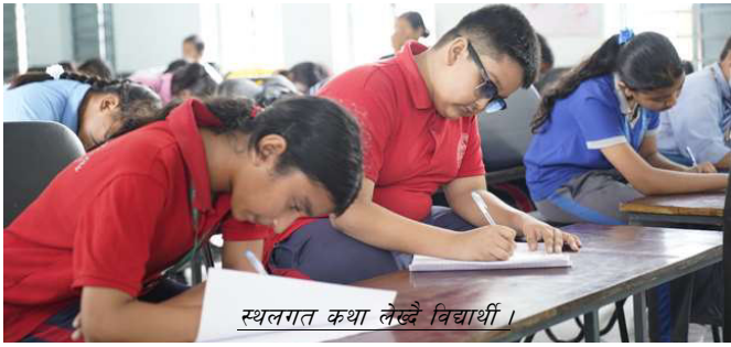
स्थलगत कथा लेख्ने विद्यार्थी ।