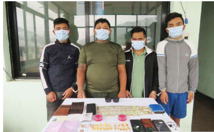
प्रहरीले सार्वजनिक गरेको गरगहनासहित नगद चोरीको घटनामा संलग्न र चोरीका गहना खरिद गर्ने व्यक्ति ।