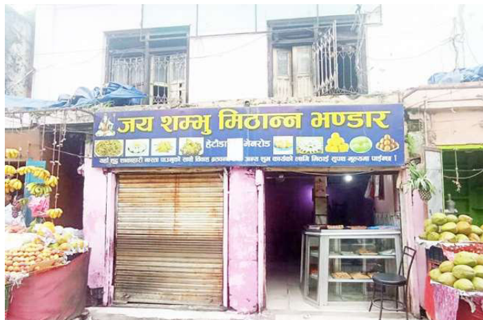
सिल गरिएको भनिएको मिष्ठान्न भण्डार सोमबार खुला अवस्थामा ।