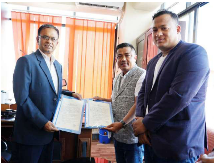
सामाजिक सुरक्षा कोष र भीमफेदी गाउँपालिकाबीच सम्झौतापत्र साटासाट गर्नुहुँदै कार्यकारी निर्देशक र पालिका अध्यक्ष।