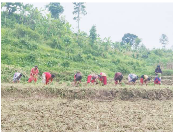
कोदो रोप्दै किसानहरू।