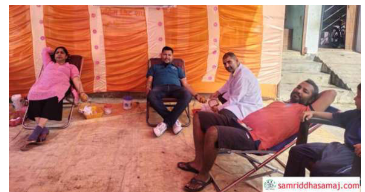
रक्तदान गरिँदै ।