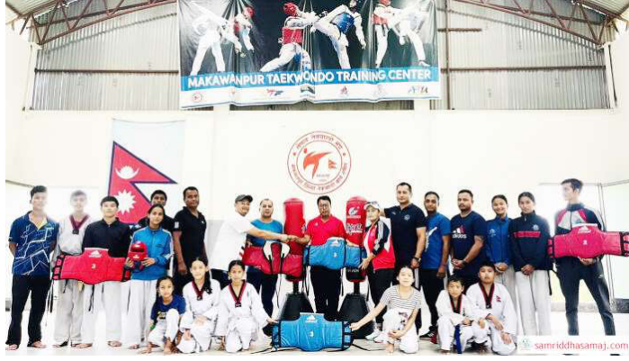
खेल सामग्री हस्तान्तरण गरिदै ।