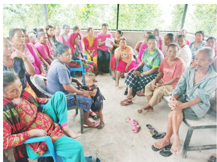
जंगली जनावरका कारण खेत, वारी बाँभो राख्न बाध्य किसानहरू।