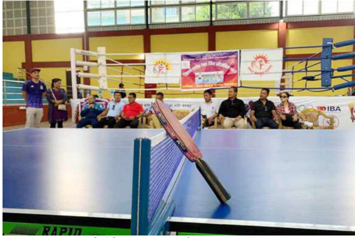
प्रतियोगिता उद्घाटन कार्यक्रममा सहभागीहरू ।