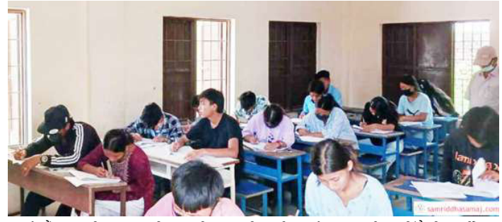
हेटौंडा-४ स्थित आधुनिक राष्ट्रिय मावि परीक्षा केन्द्रमा परीक्षा दिँदै विद्यार्थी ।