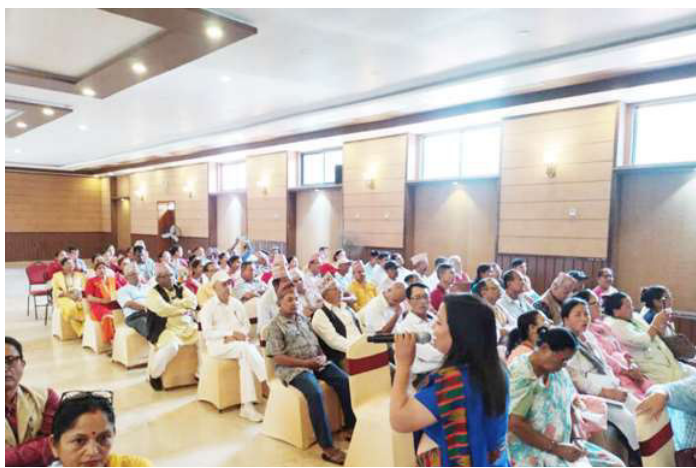
भेलामा सहभागी अध्यक्ष र उपाध्यक्षहरू ।