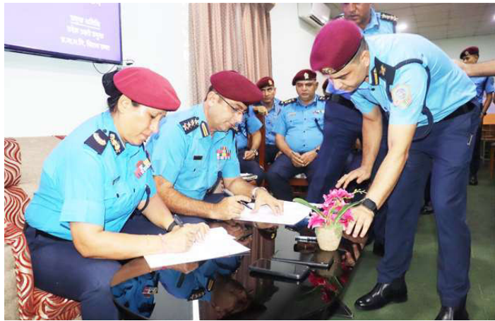
मातहतका प्रहरी कार्यालय प्रमुखसँग कार्यसम्पादन सम्झौता गर्नुहुँदै प्रदेश प्रहरी प्रमुख राणा।