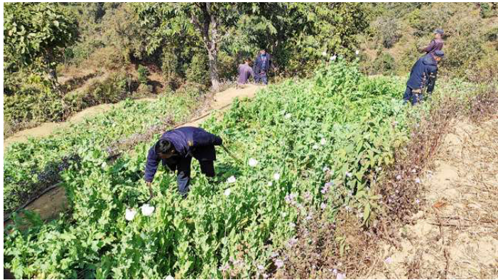
अफिम खेती नष्ट गर्दै मकवानपुर प्रहरी। फाइल तस्वीर।