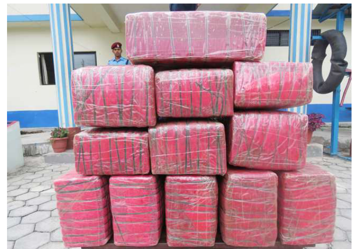
प्रहरीले बरामद गरेको गाँजा। फाइल तस्वीर।