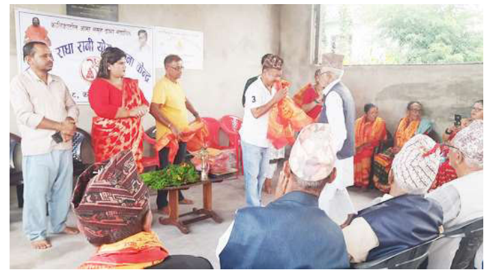
ज्येष्ठ नागरिकलाई सम्मान गरिँदै।