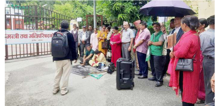
मुख्यमन्त्री कार्यालयको गेटमा धर्ना दिँदै सामुदायिक वन अभियन्ता।