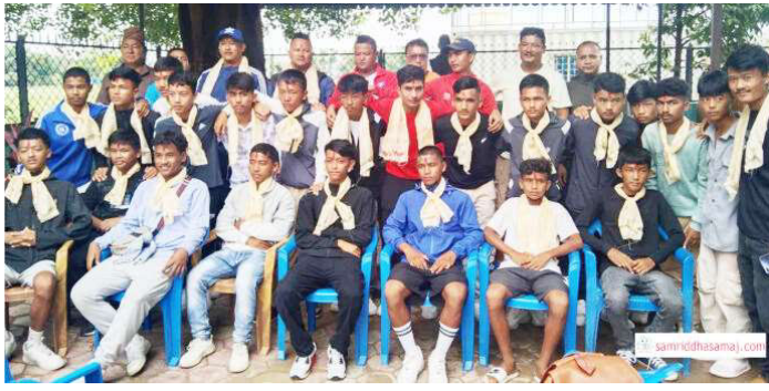
मकवानपुरका खेलाडीको विदाई गरिँदै । फाइल तस्वीर