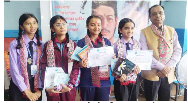
पुस्तक चर्चामा उत्कृष्ट तीन विद्यार्थीहरु पुरस्कृत भएपछि ।