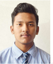
Roman B.k 3.35