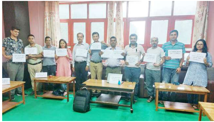
क्याम्पस प्रमुखको राजिनामा माग्दै आन्दोलनमा रहेका प्राध्यापकहरु ।