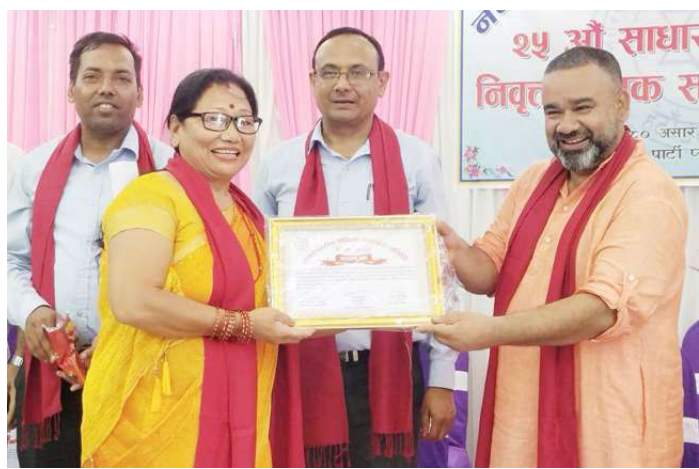
अवकाश प्राप्त शिक्षकलाई सम्मान गरिँदै ।