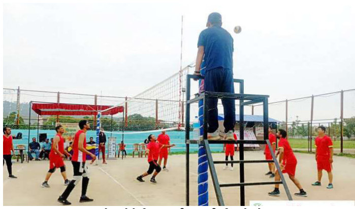
कमाने एकेडेमी र जनप्रिय माविबीचको खेल ।