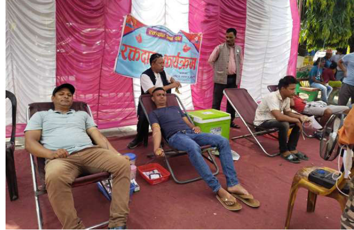
रक्तदान गर्दै रक्तदाता ।