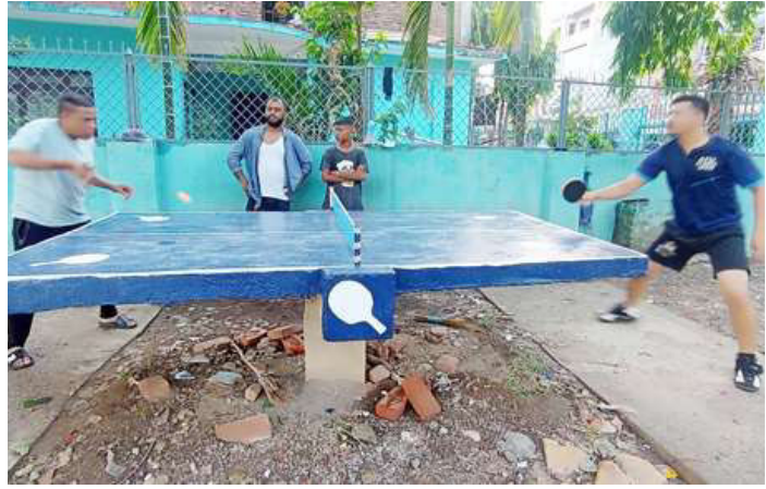
हृप्रचौरमा टेबलटेनिस खेल्दै ।