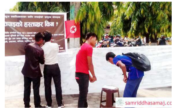
हस्ताक्षर संकलन गरिँदै ।