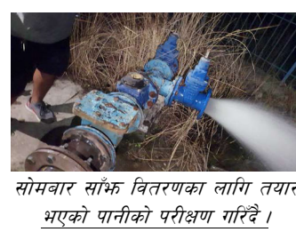
सोमबार साँझ वितरणका लागि तयार भएको पानीको परीक्षण गरिँदै।