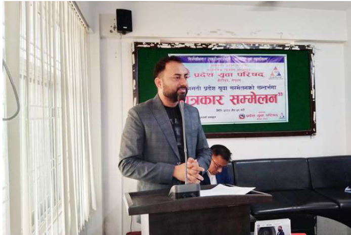
प्रदेश युवा परिषदको आयोजनामा आगामी असार ११ र १२ गते हेटौँडामा प्रदेश युवा सम्मेलन हुने भएको छ। सोमबार बागमती प्रदेशको सामाजिक विकास मन्त्रालयको सभाहलमा पत्रकार सम्मेलन गर्दै आयोजक प्रदेश युवा परिषदले सम्मेलनबारे जानकारी गराएको हो।