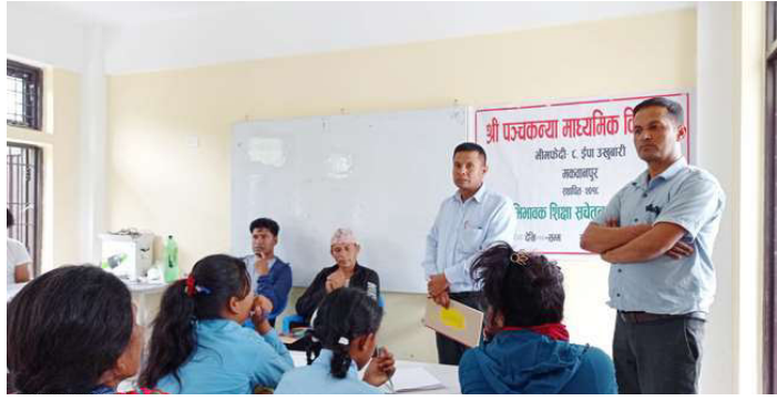
अभिभावक शिक्षा कार्यक्रममा सहभागीहरू ।