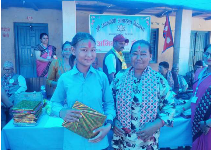
पुरस्कृत विद्यार्थी र सम्मानित अभिभावक ।