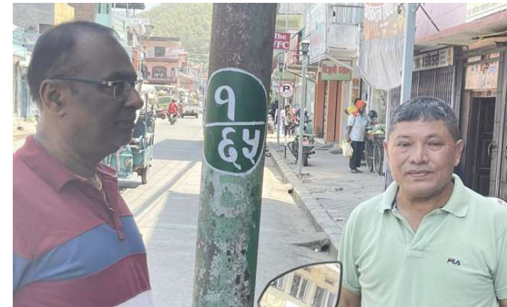
विजुलीको पोलमा नम्बरीकरण कार्यको सुरुवात गर्दै।