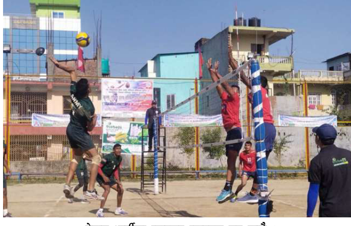
नेपाल आर्मीका स्पाइकर स्पाइक सट हाउँदै।