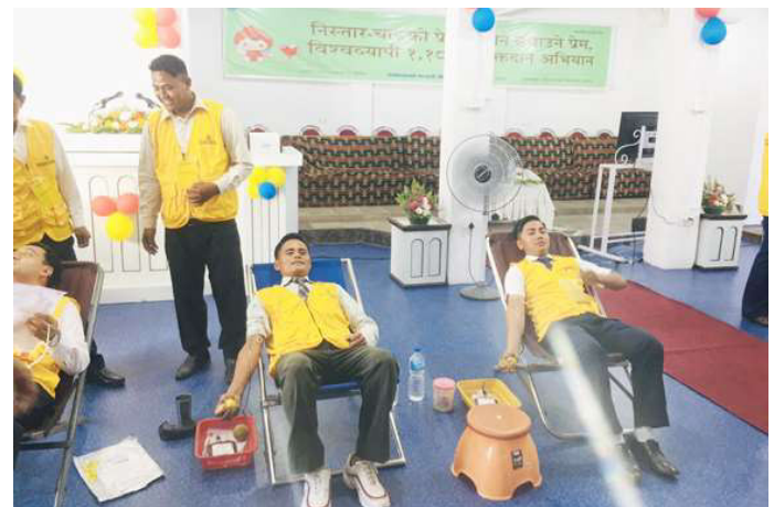
रक्तदान गर्दै रक्तदाता ।