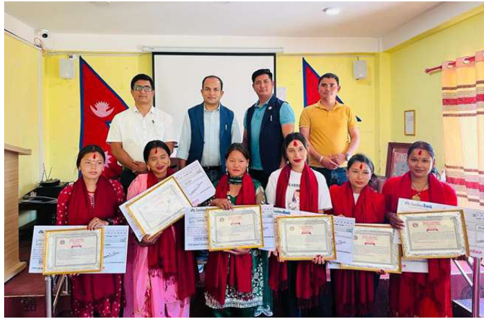
चेली सम्मानपछि सामूहिक तस्वीर खिचाउँदै ।