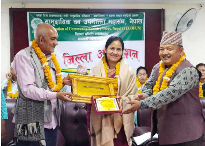
ग्रामीण आँखा केन्द्रको उद्घाटन गरिदै ।