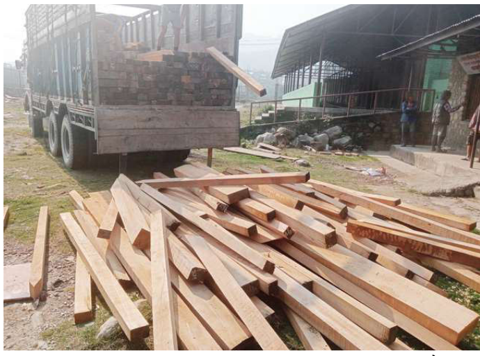
थाहा नगरको पालुडमा स्थापना गरिएको काठ डिपोमा काठ पुऱ्याइँदै ।