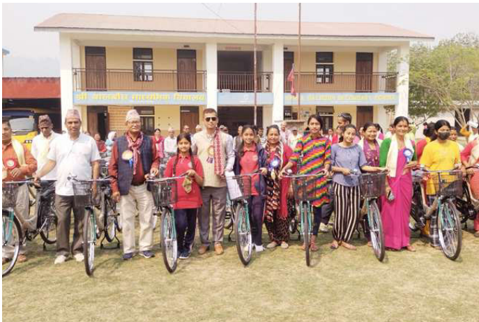
छात्रालाई साइकल हस्तान्तरणपछि सामूहिक तस्वीर खिचाउँदै।