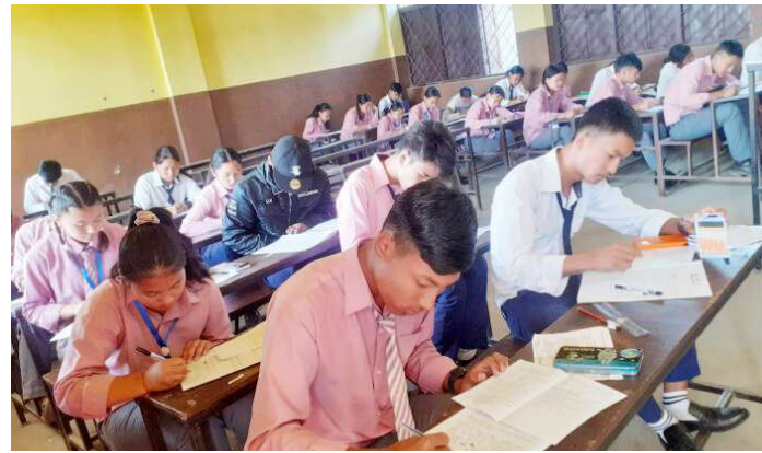
हेटौंडा-९ स्थित प्रगति मावि परीक्षा केन्द्रमा परीक्षा दिँदै विद्यार्थी ।