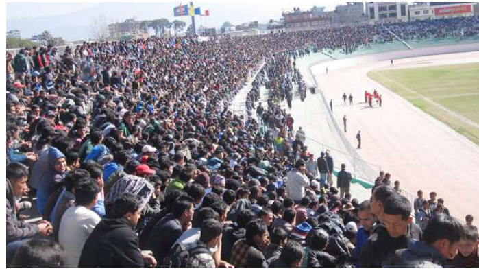
१० वर्षअघिको रंगशाला १० वर्षअघिको रंगशाला ।

१० वर्ष अगाडि त्यही ५०० तिरेर नेपालको मैत्रीपूर्ण खेल हेर्न भरीभराउ हुनेगर्थ्यो, दशरथ रंगशाला । अफ टिकट 'ब्याक' मा बेच्नेहरू पनि हुनेगर्थे । ५०० को टिकटलाई २००० सम्म लिने गर्थे । यही ताल रहिरहने हो र अझै पनि सम्बन्धित निकाय र सरकारले वास्ता नगर्ने हो भने अर्को १० वर्षमा २०० तिरेर पनि खेल हेर्न दर्शक आउन मुस्किल हुनेछ । सीमित सुविधाको बावजुत पनि खेलाडीहरूले चाहे सफलता हासिल गर्न सक्ने उदाहरण हेर्न अरु कतै जानै पर्दैन, नेपाली क्रिकेट टिमलाई हेरे पुग्छ । अहिलेभन्दा १५/१६ वर्ष अगाडि फुटबलको तुलनामा क्रिकेटमा लगानी धेरै थिएन । त्यो बेला फुटबलमा ए डिभिजन लिग विजेतालाई १ करोड सम्मको नगद पुरस्कार थियो तर क्रिकेटमा ५ लाख पुरस्कार पनि हुन मुस्किल थियो । खेलाडीहरूले एउटै ब्याटले हरेक प्रतियोगिता धान्न पर्ने हुन्थ्यो । एसोजरको कुरा त कहाँ हो कहाँ । वर्षमा घरेलु र अन्तर्राष्ट्रिय गरेर १० देखि १५ खेल खेल्न