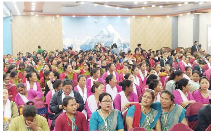
प्रभातफेरीपछि आयोजित सभामा सहभागी सहकारीकर्मीहरू ।