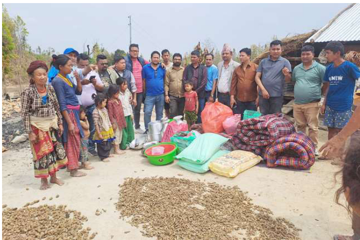
अग्नि पीडितलाई सहयोग सामग्री हस्तान्तरण गरिँदै।