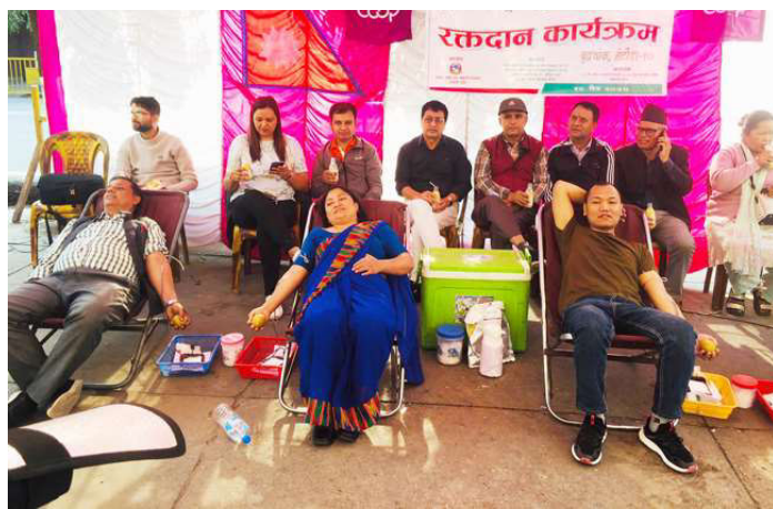
शनिबार बिहान रक्तदान गर्दै रक्तदाता ।