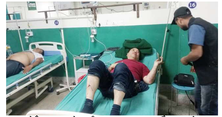
हेटौंडा अस्पतालको आकस्मिक कक्षमा उपचार गराउँदै एक घाइते।