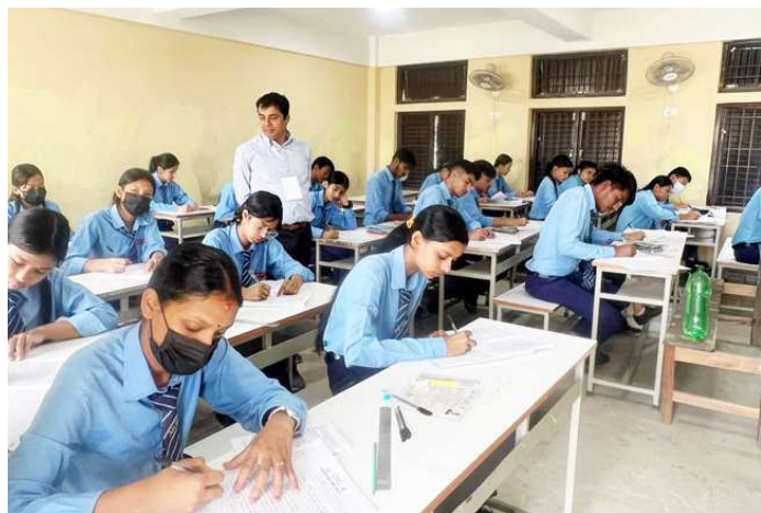
हेटौंडा-४ स्थित भूतनदेवी मावि परीक्षा केन्द्रमा परीक्षा दिँदै विद्यार्थी ।