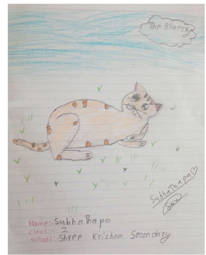
Name: Subha Thapa class: 2 school: Shree Krishna Secondary