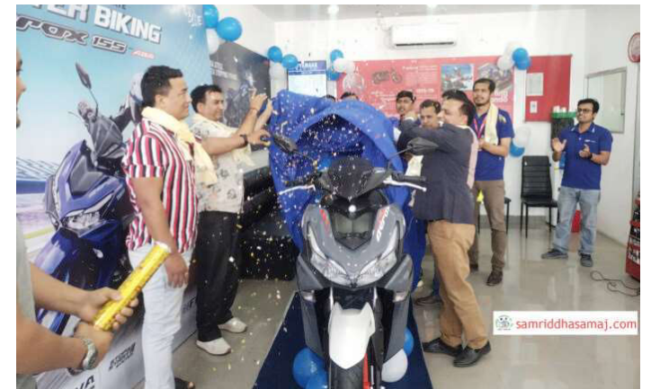
एरोक्स स्कुटर सार्वजनिक गरिँदै।