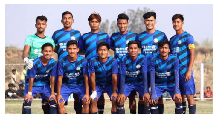
मकवानपुर-११ फुटबल टिम।