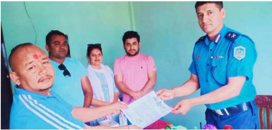
रास्वपा मकवानपुरले प्रहरीलाई बुझाएको ध्यानाकर्षणपत्र । प्रहरी प्रवक्ता कार्कीलाई ध्यानाकर्षणपत्र बुझाउँदै रास्वपा मकवानपुरका नेताहरू ।