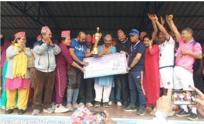
उपाधिसहित ७ नम्बर वडाको टिम ।