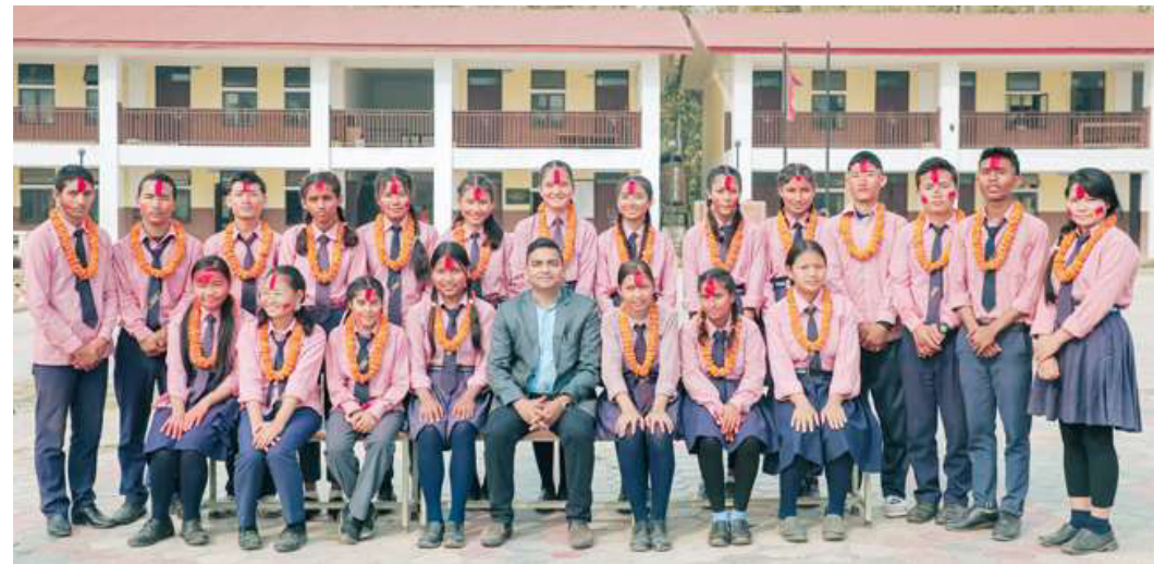
एसईईमा सहभागी हुने हेटौँडा-१८, फर्केचौरस्थित गोरक्षनाथ माविका विद्यार्थी।

जमुना थिङ हेटौँडा: यस वर्षको माध्यमिक शिक्षा परीक्षा (एसईई) आज शुक्रबारबाट देशभर सुरु हुँदैछ। परीक्षा बिहान ८ बजेदेखि सुरु हुनेछ। वैत २९ गतेसम्म सञ्चालन हुने माध्यमिक शिक्षा परीक्षा (एसईई)मा बागमती प्रदेशबाट यस वर्ष एक लाखभन्दा बढी परीक्षार्थीले एकैसाथ परीक्षा दिँदैछन्। एसईईमा एक लाख एक हजार ७ सय ३३ जना परीक्षार्थीले परीक्षा दिँदैछन्। प्रदेशका १३ जिल्लामध्ये काठमाडौँबाट सबैभन्दा बढी र रसुवाबाट सबैभन्दा कम परीक्षार्थीले परीक्षा दिँदैछन्। काठमाडौँबाट ३६ हजार ५ सय ७७ जना र रसुवाबाट ६ सय २८ जना परीक्षार्थीले परीक्षा दिँदैछन्। बागमती प्रदेशको भक्तपुरबाट ५ हजार ८ सय जना र ललितपुरबाट ९ हजार ८ सय ९९ जना परीक्षार्थीले परीक्षा दिँदैछन्। काभ्रेपलाञ्चोकबाट ६ हजार ४ सय ३६ र सिन्धुपाल्चोकबाट ३ हजार ९ सय ८५ जना परीक्षार्थीले परीक्षा दिँदैछन्। यस्तै, नुवाकोटबाट ४ हजार ३ सय जना, रसुवाबाट ६ सय २८ जना, धादिङबाट ५ हजार ३ सय ८६ जना, चितवनबाट १० हजार ८ सय ५६ जना परीक्षार्थीले परीक्षा दिँदैछन्। रामेछापबाट ३ हजार २ सय २५ जना, दोलखाबाट ३ हजार ६२ जना, सिन्धुलीबाट ५ हजार २ सय ४९