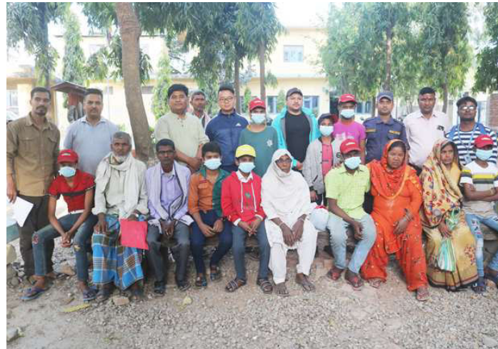
परिवारका सदस्यसहित पारिवारिक पुनर्मिलन हुँदै गरेका बालकहरु।

सिन्धुपाल्चोकका २४, नुवाकोटका २४, रसुवाका ५, धादिङका २८, मकवानपुरका २५, चितवनका ४२, रामेछापका २२, दोलखाका १९ र सिन्धुलीका २६ वटा परीक्षा केन्द्रबाट परीक्षार्थीले परीक्षा दिँदैछन्। बागमती प्रदेशको ४ सय ३४ वटा परीक्षा केन्द्रबाट परीक्षार्थीहरूले एकैसाथ परीक्षा दिँदैछन्। केन्द्राध्यक्ष ४ सय ३४ जना, सहायक केन्द्राध्यक्ष ७ सय ३७ जना, निरीक्षक ५ हजार ८६ जना, परीक्षा सहायक १ हजार ६४ जना, कार्यालय सहयोगी २ हजार ५५ जना र सुरक्षाकर्मी ६ हजार ५ सय १० जना गरी १५ हजार ८ सय ८६ जना जनशक्ति एसईई परीक्षामा खटिँदैछन्। परीक्षाका लागि प्रदेशभित्रका सबै जिल्लाका परीक्षा केन्द्रहरूमा उत्तरपुस्तिका पुऱ्याइसकिएको जनाइएको छ। यस्तै, परीक्षा केन्द्र नजिक रहेको प्रहरी चौकीमा प्रश्नपत्र पुगिसकेको, केन्द्राध्यक्ष नियुक्ति गरी अभिमुखीकरण कार्यसमेत गरी परीक्षासम्बन्धी पूर्वतयारीको सम्पूर्ण कार्य सम्पन्न गरिसकिएको जनाइएको छ। बिहान ९१ बजेसम्म सञ्चालन हुने एसईई परीक्षालाई मर्यादित, भयरहित, निर्धक्करूपमा परीक्षा दिने वातावरण निर्माण गर्न अभिभावक, विद्यालयलाई आग्रह गरिएको छ। स्वास्थ्यमा सुरक्षा व्यवस्थापनका लागि नर्सलाई समेत व्यवस्थापन गर्न आग्रह गरिएको छ।