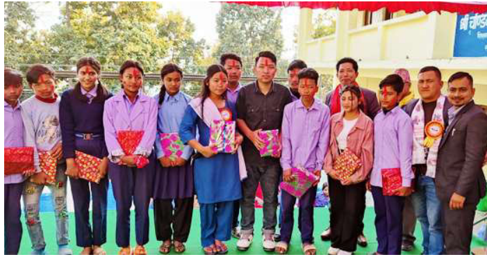
विद्यालयको वार्षिकोत्सवको अवसरमा पुरस्कृत विद्यार्थीहरु ।