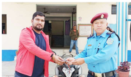
घिमिरेलाई मोटरसाइकलको चाबी फिर्ता गर्दै प्रहरी।