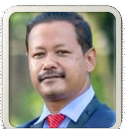
अधिवक्ता अरुणि के.बी. प्रतिरक्षक कानून व्यवसायी को हुन् ?

नेपालको सन्दर्भमा कानूनमा कम्तीमा स्नातक तह ९ जस्तोकि: LL.B., B.A.LL.B.,B.L.) उतीर्ण गरिसकेपछि नेपाल बार काउन्सिलको परिषद उतीर्ण भएपछि कानून व्यवसायी बन्न सकिन्छ । कानून व्यवसायी मध्यपनि फौजदारी मुद्दामा प्रतिवादीको तर्फबाट बहस, पैरवी र वकालत गर्ने कानून व्यवसायी प्रतिरक्षक कानून व्यवसायी हुन् । एक प्रतिरक्षक कानून व्यवसायी कुनै फौजदारी मुद्दा वा अभियोजनमा आफ्नो पक्षको प्रतिनिधित्व गर्दछ ।