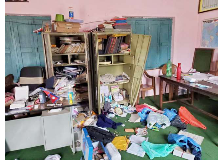
चोरले तोडफोड गरेको दराज र विद्यालयको कार्यालय ।