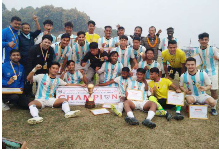
उपाधिसाथ मनाड मस्याङ्दी क्लबका खेलाडी तथा पदाधिकारी ।