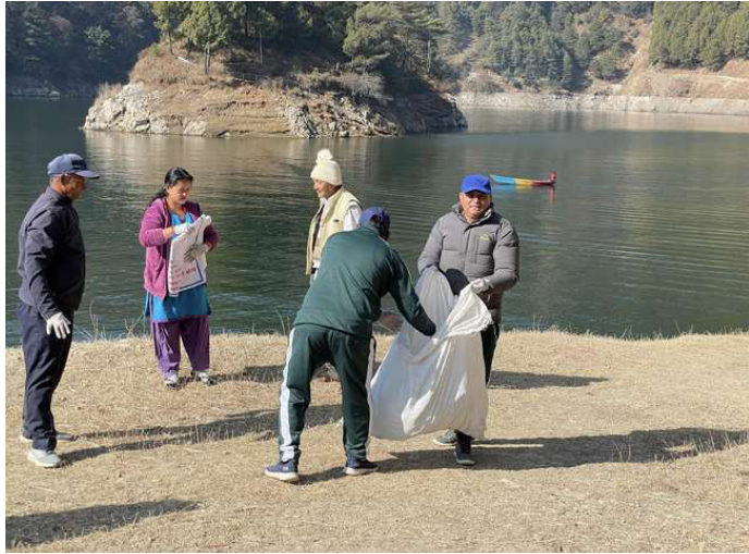
ताल क्षेत्रको सरसफाई गरिँदै ।