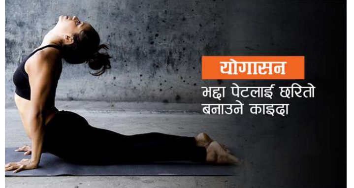
योगासन महा पेटलाई छरितो बनाउने काइडा

पेटमा बोसो जमेपछि शरीर भद्दा देखिन्छ । भद्दा देखिने मात्र होइन, यसले अनेक रोगसमेत निम्त्याउँछ । मधुमेह, उच्च रक्तचाप जस्ता दीर्घरोगले ग्रस्त बनाउँछ । त्यसो भए मोटोपन कसरी घटाउने ? यसका लागि धेरैले खानपानमा