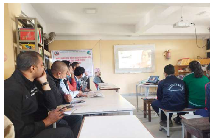
वडास्तरमा सरोकारवालाबाट बालमैत्री पालिकासम्बन्धी अभिमुखीकरण गरिँदै।