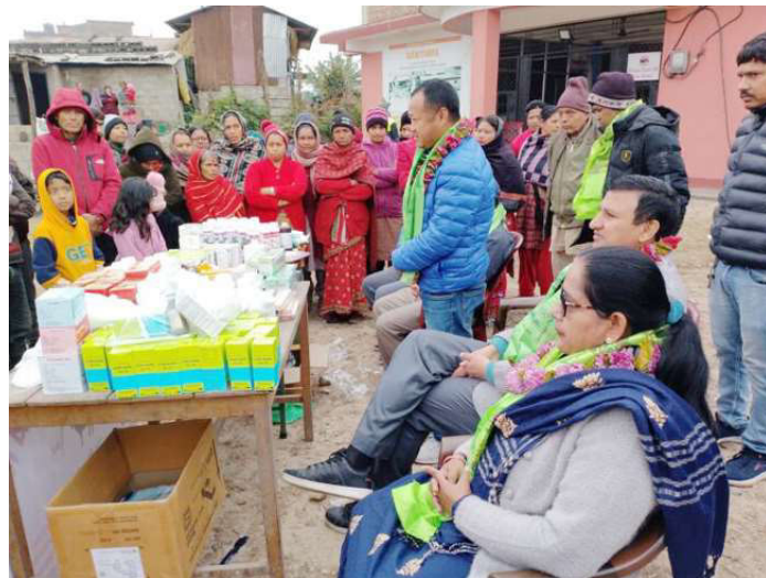
निःशुल्क पशु स्वास्थ्य शिविरमा सहभागीहरू ।