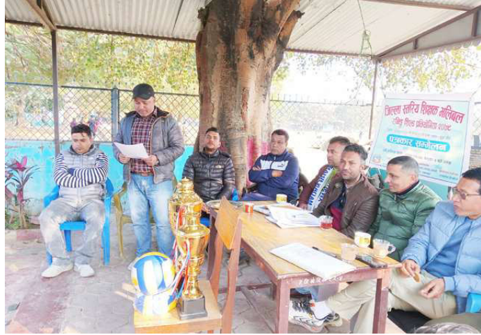
शिक्षक भलिबल प्रतियोगिताको बारेमा जानकारी गराउँदै आयोजक।