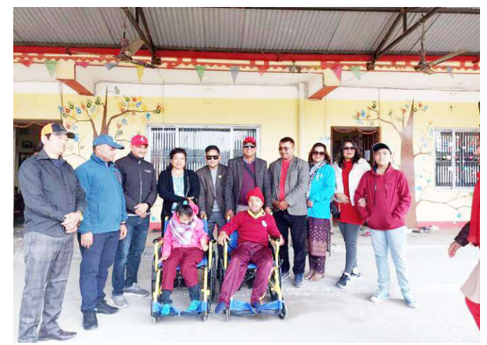
आशा विशेष पाठशालालाई हवीलचेयर हस्तान्तरण गरिदै।