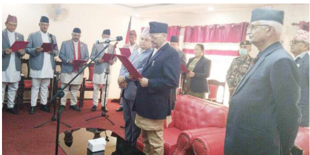
प्रदेश प्रमुखबाट सपथ ग्रहण गर्दै नवनियुक्त मन्त्रीहरु।