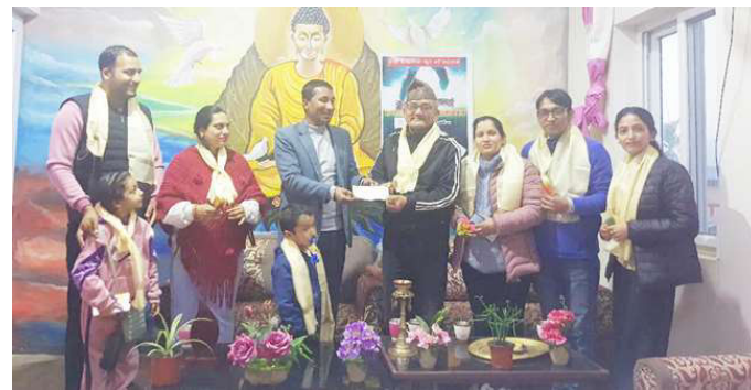
एक लाख रुपैयाँ सहयोग हस्तान्तरण गरिँदै।