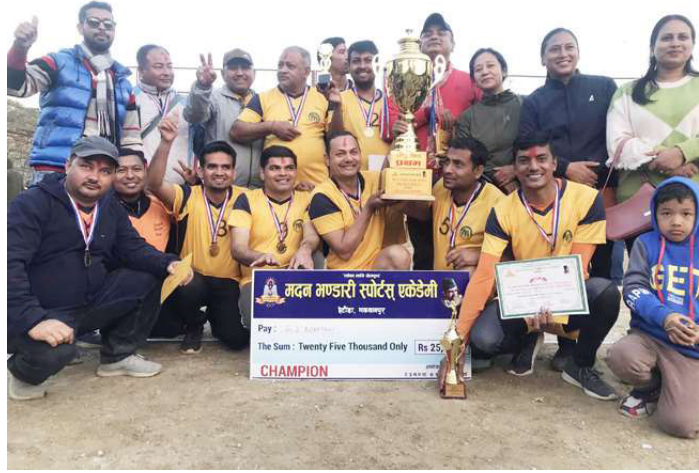
उपाधि साथ जीएस निकेतन माविको शिक्षक भलिबल टिम ।