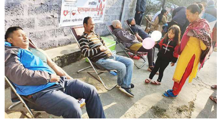
शनिवार आयोजित कार्यक्रममा रक्तदान गर्दै रक्तदाता ।