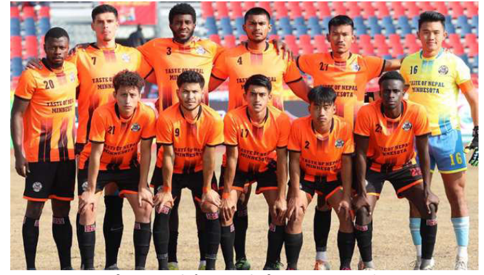
भुटनिज युथ स्पोर्ट्स क्लबको टिम । फाइल तस्वीर ।