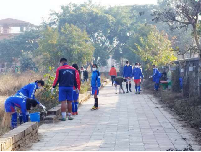
नेपाल खेलकुद महासंघले हुप्रचौर सरसफाई गर्‍यो